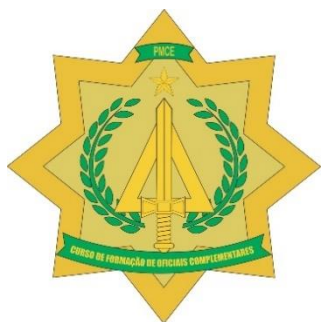
Figura 1: Padrão metalizado

metálico será confeccionado em metal esmaltado nas cores que representam (figura 1) e no padrão emborrachada com tons de cinza. Os distintivos terão por dimensões 20 mm de raio e as cores de acordo com as prescrições da tabela 01.