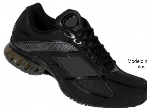
Modelo meramente ilustrativo

Tênis Predominante Preto - Praça (Educação Física)