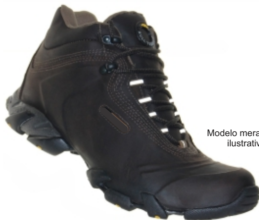
Modelo meramente ilustrativo

Botina de Segurança Trânsito e Sala de Aula (Preta)