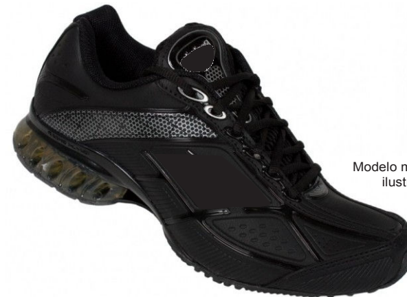
Modelo meramente ilustrativo

Tênis Predominante Preto - Praça (Educação Física)