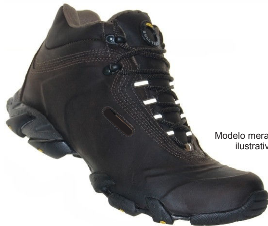
Modelo meramente ilustrativo

Botina de Segurança Trânsito e Sala de Aula (Preta)